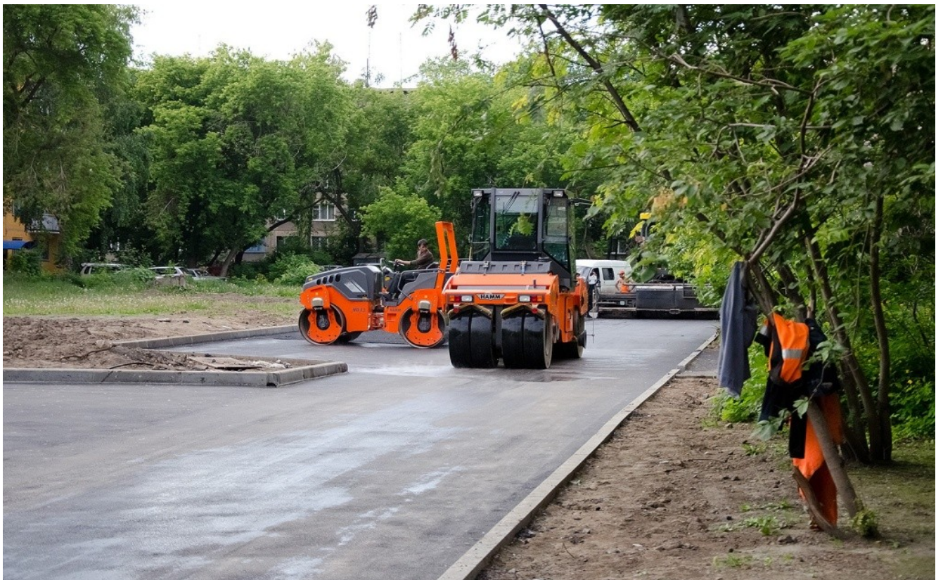
Ремонт дворовых проездов