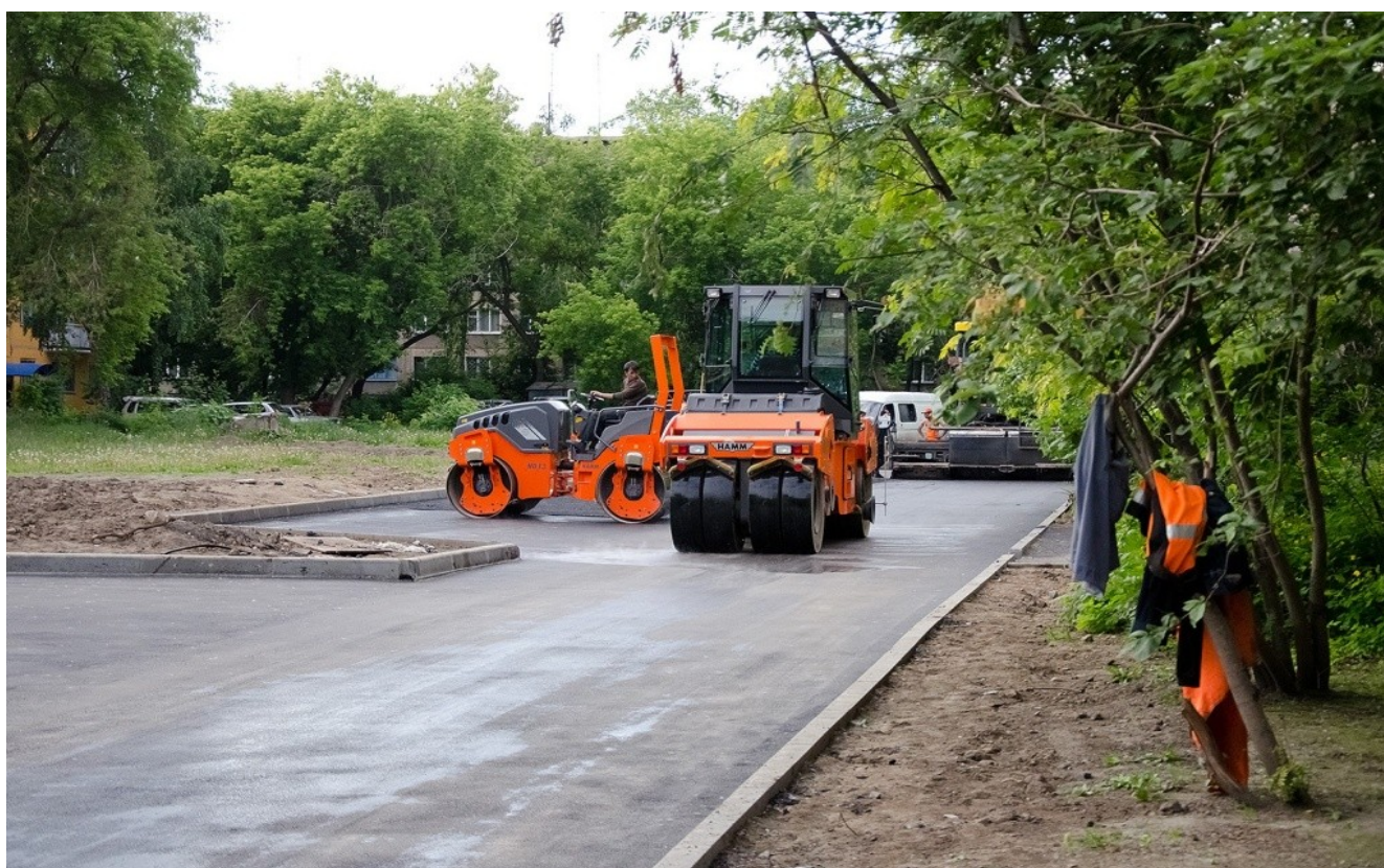
Ремонт дворовых проездов