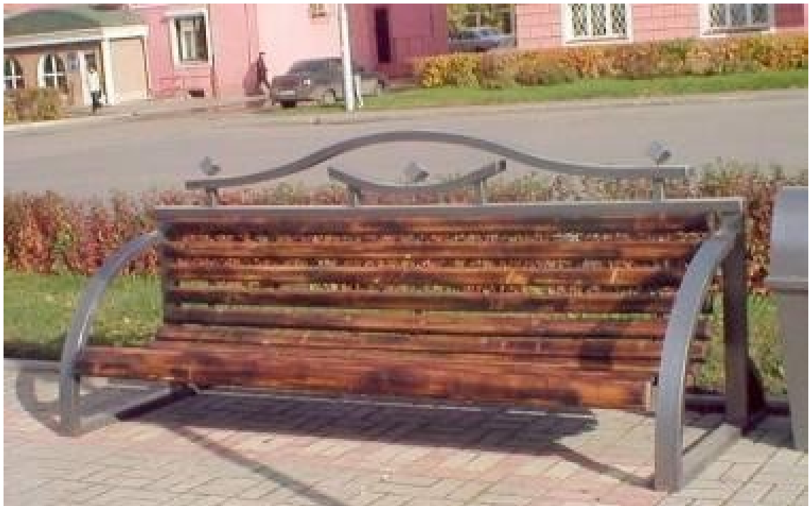
Парковый диван ДП-1, для установки на общественных территориях