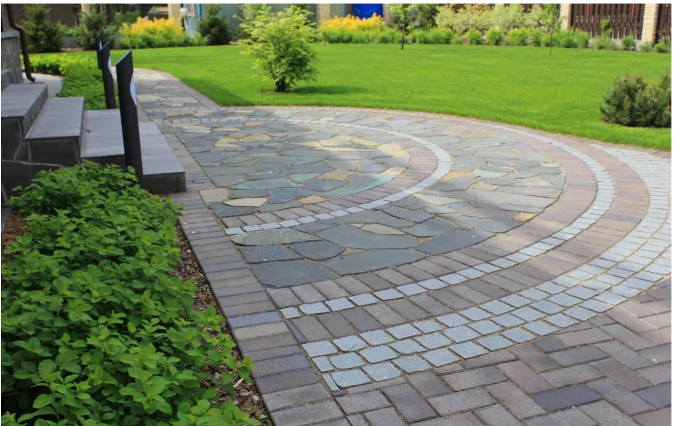
Ремонт твердых покрытий аллей