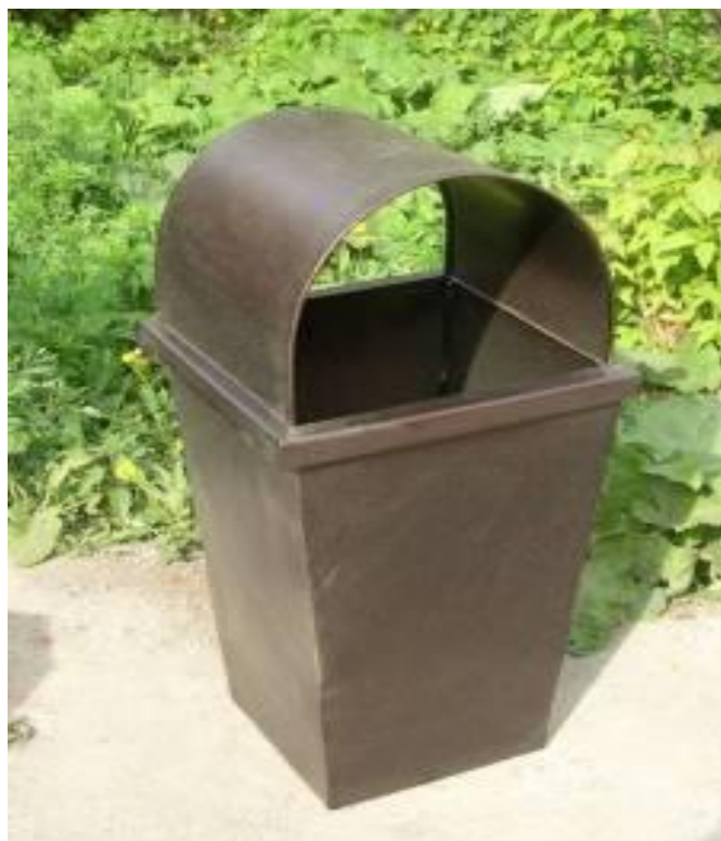
Урна УП-1, для установки на общественной территории