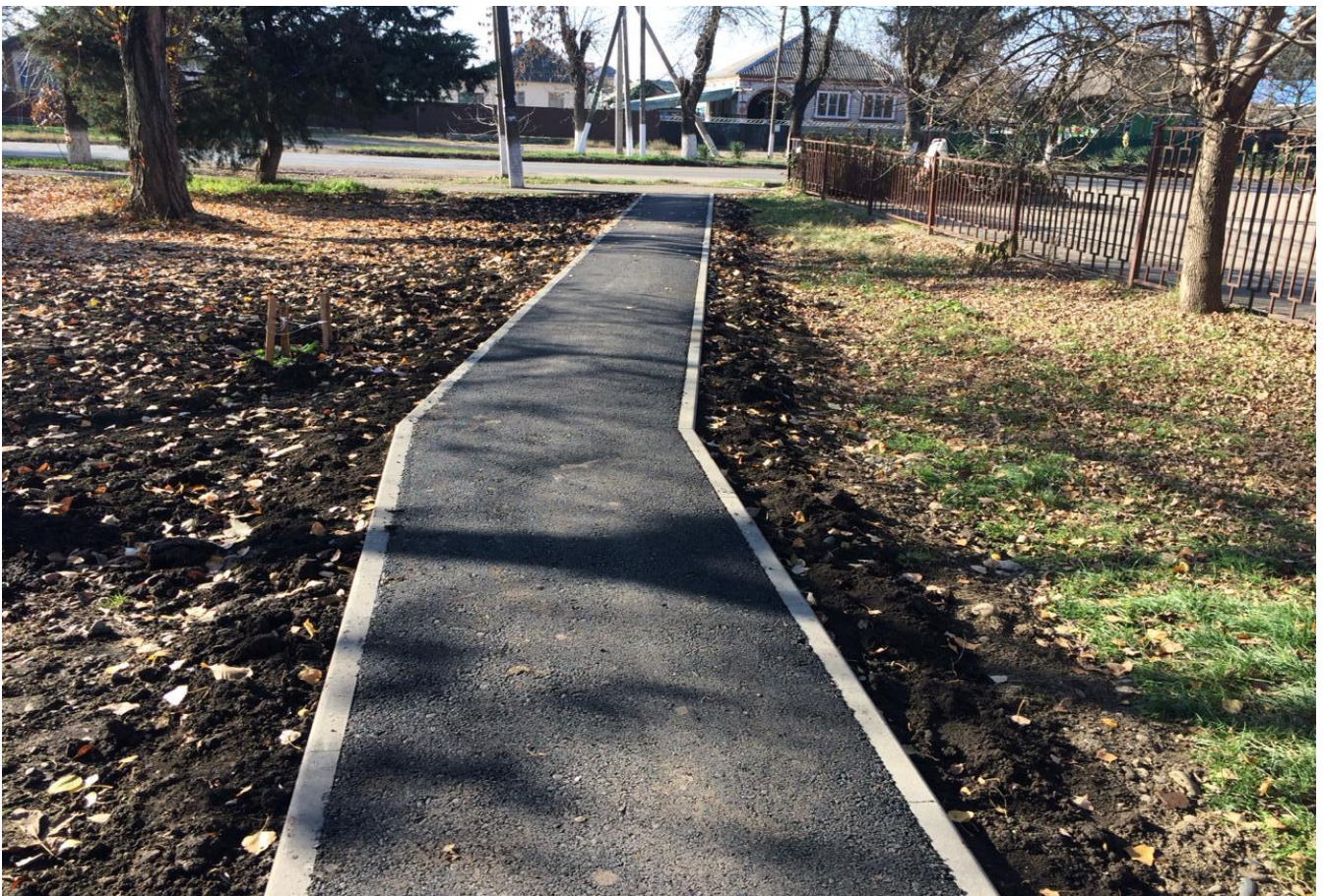
Ремонт тротуаров, пешеходных дорожек