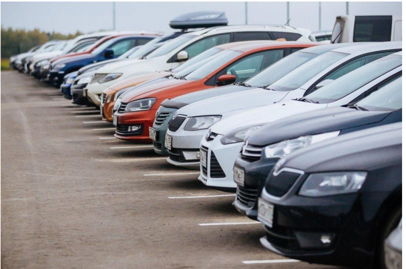
Ремонт автомобильных парковок