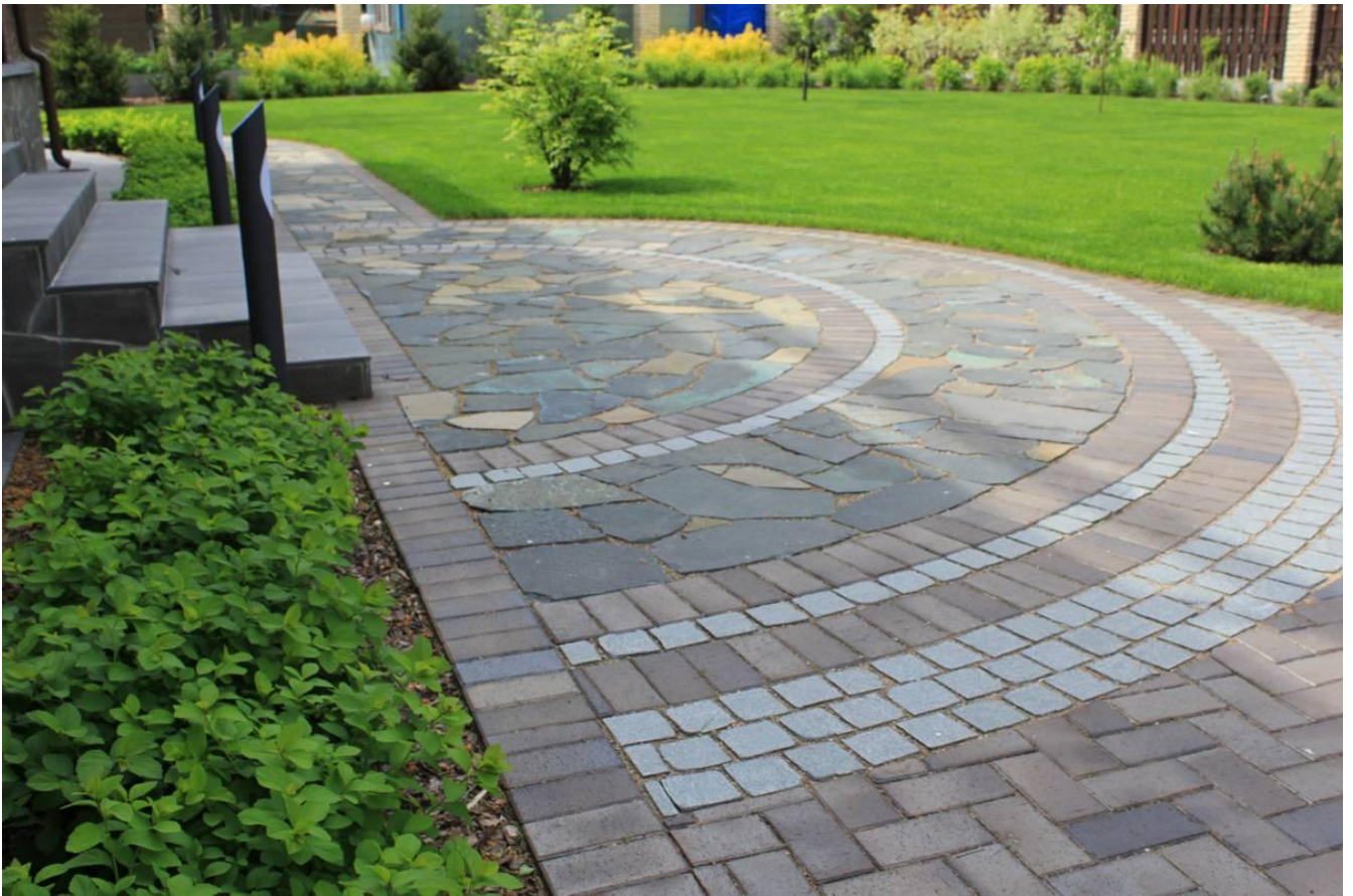
Ремонт твердых покрытий аллей