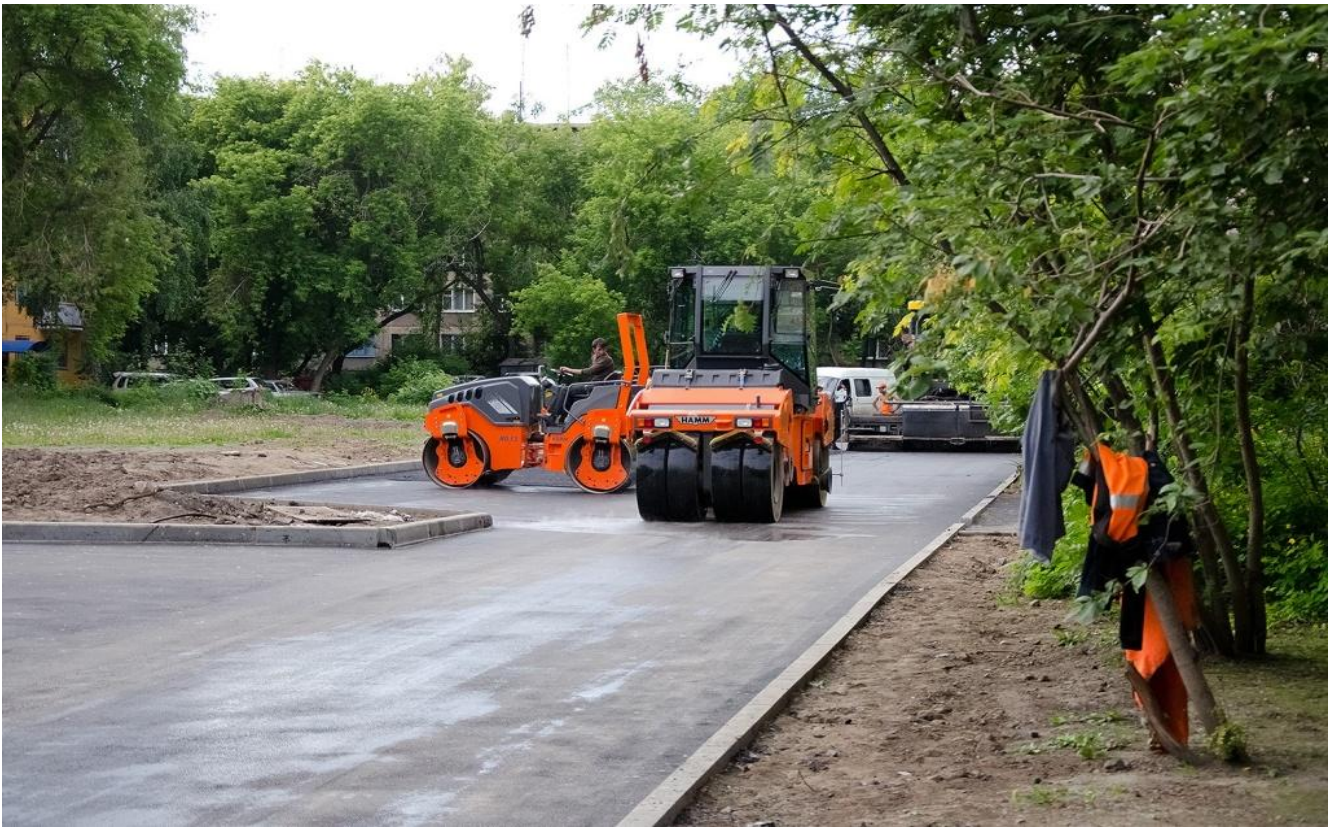
Ремонт дворовых проездов