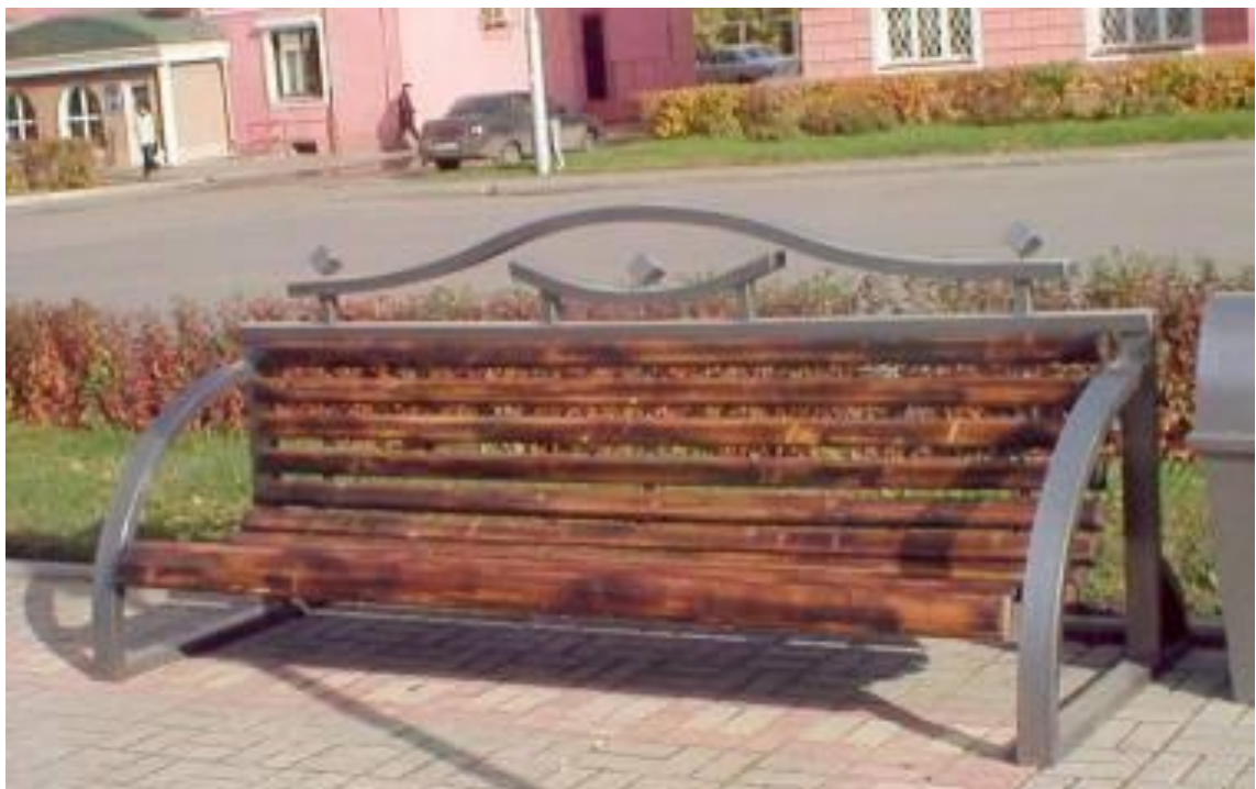
Парковый диван ДП-1, для установки на общественных территориях