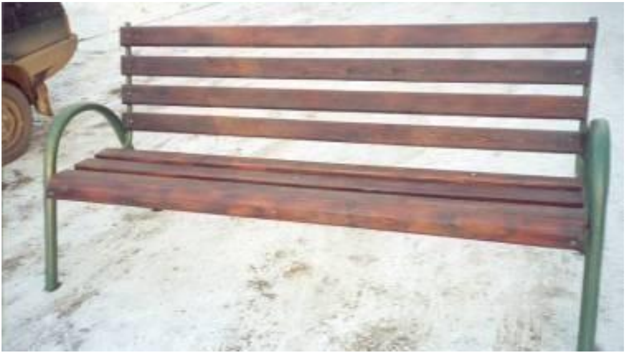
Скамья С1, для установки на дворовых территориях